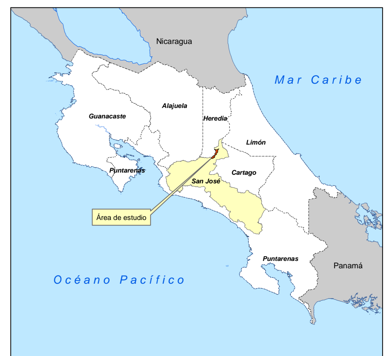
Diagrama de Ubicación